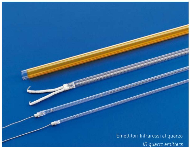
Emettitori Infrarossi al quarzo IR quartz emitters

Helios Quartz ha improntato la propria realtà produttiva non solo su prodotti standard, ma in virtù della propria esperienza, flessibilità, continuo miglioramento e studio di nuove tecnologie e applicazioni, è in grado di supportare il Cliente nella individuazione del prodotto idoneo anche con realizzazioni speciali su specifiche tecniche del Cliente stesso.