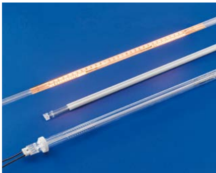
Emettitori Infrarossi al quarzo IR quartz emitters

in the pre-heating of the glass before deposition