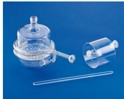
Articoli a disegno in vetro di quarzo Quartz glass items

Helios Quartz has characterized its manufacture processes not only on standard products, instead thanks to its experience, flexibility, continuous improvement and research of new technology and applications it is able to support the Customer in the identification of the suitable product also with the prototyping of special items made expressly for the specific Customer.