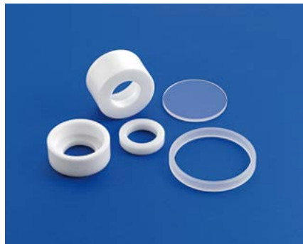
Articoli a disegno in vetro di quarzo Quartz glass items