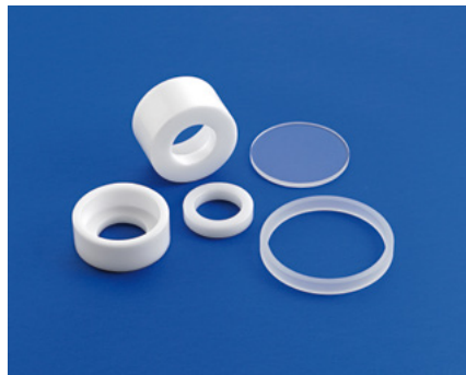
Quarzglasprodukte nach Zeichnung Quartz glass items