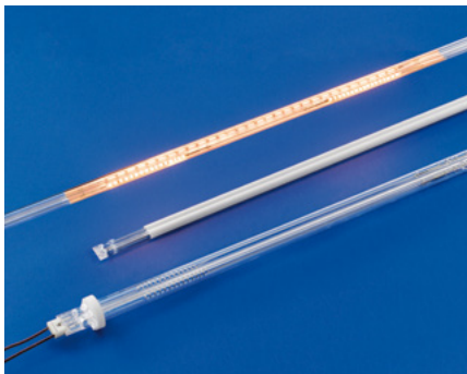
Infrarot Strahler aus Quarzglas IR quartz emitters

in the pre-heating of the glass before deposition