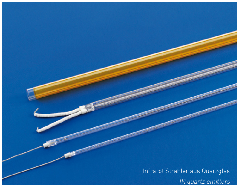
Infrarot Strahler aus Quarzglas IR quartz emitters

Helios Quartz hat die Produktion nicht nur auf Standardprodukte konzentriert; auf der Basis unserer Erfahrung, unserer Flexibilität, der andauernden Verbesserung der Produkte und der Entwicklung von neuen Technologien sind wir in der Lage, den Kunden bei der Auswahl des geeignetsten und anwendungsspezifischen Produkts zu beraten oder auch Produkte je nach Sonderanforderungen zu entwerfen.